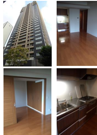
※写真は入居前のものです